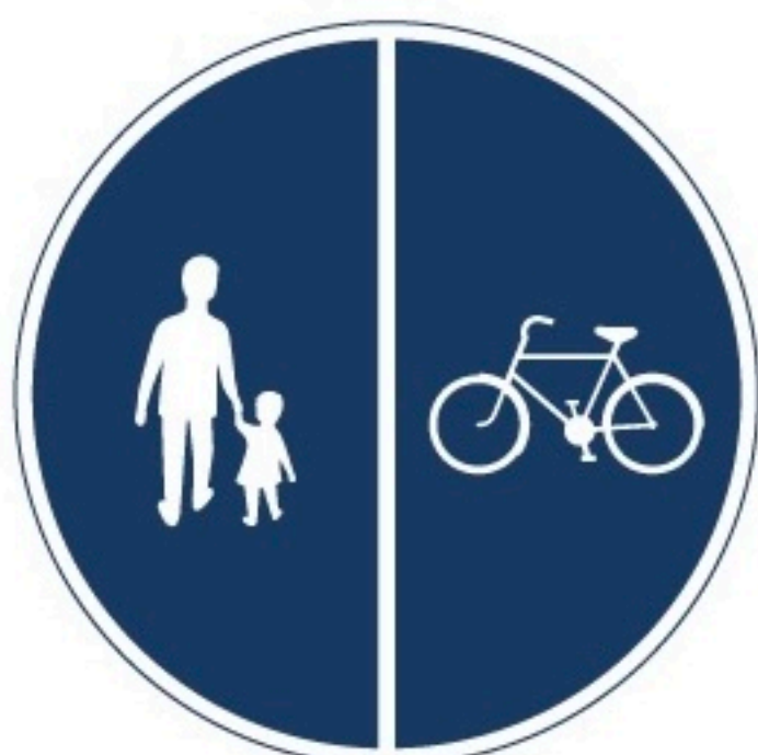
Delad gång- och cykelbana