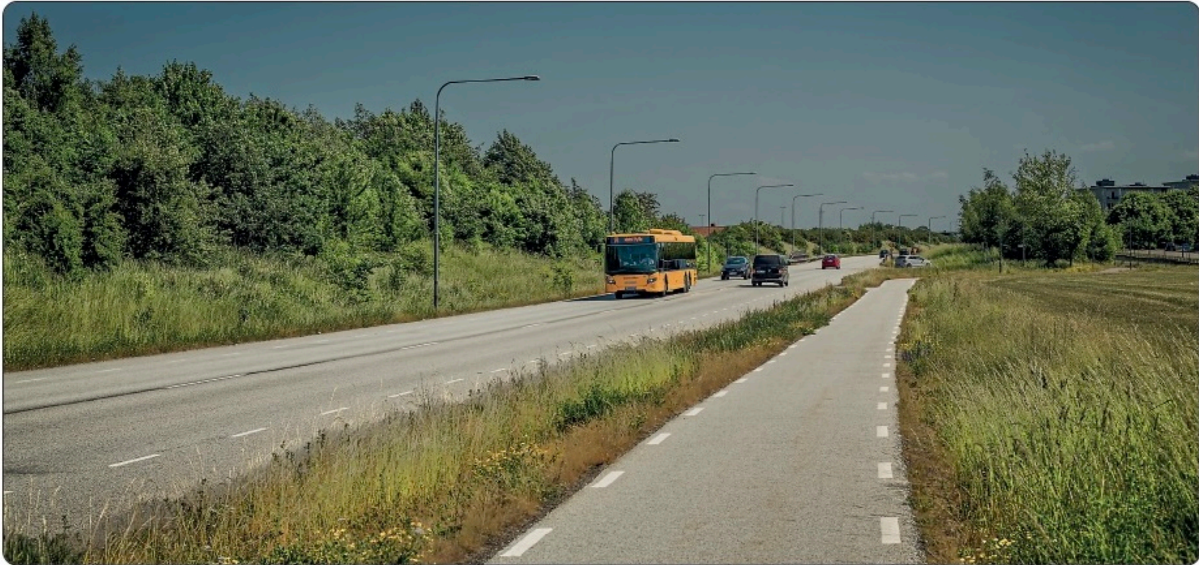
Här finns det bara bilväg och cykelbana.

Gå längs med kanten så att cyklarna kan komma fram.