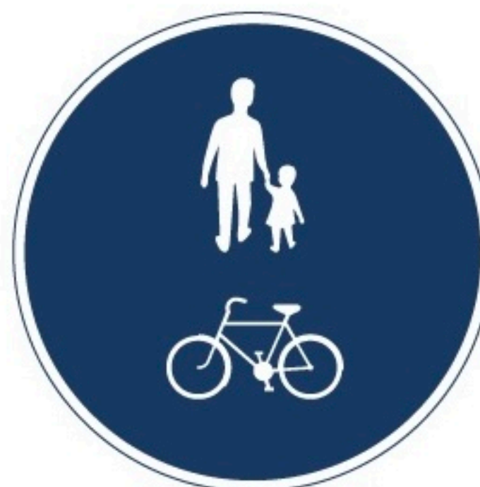
Gemensam gång- och cykelbana