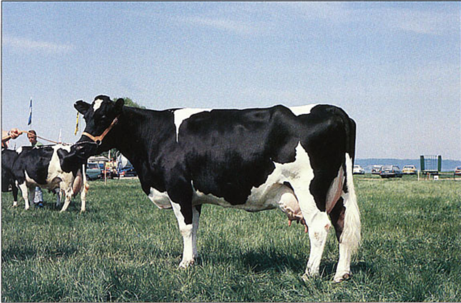
SLB (Svensk Låglands Boskap)

Nästan lika vanlig som SRB är rasen SLB . Det betyder Svensk Låglands Boskap. Låglandskon är något större än SRB-kon och finns i de flesta av världens jordbruksländer.