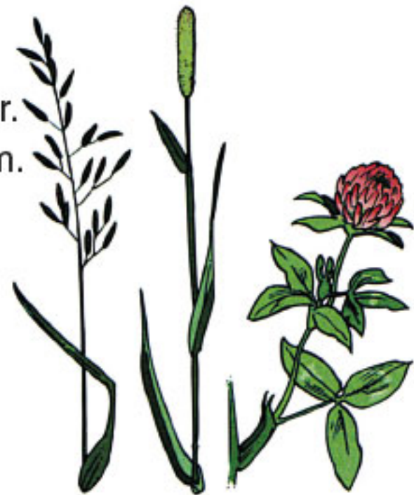
Ängsvingel, timotej och klöver är växter som ingår i hö.

Spannmål innehåller mycket energi. Korn och havre är exempel på spannmål. Havre kan ges antingen hel eller krossad. Korn och andra sädeslag ges krossade eller malda.