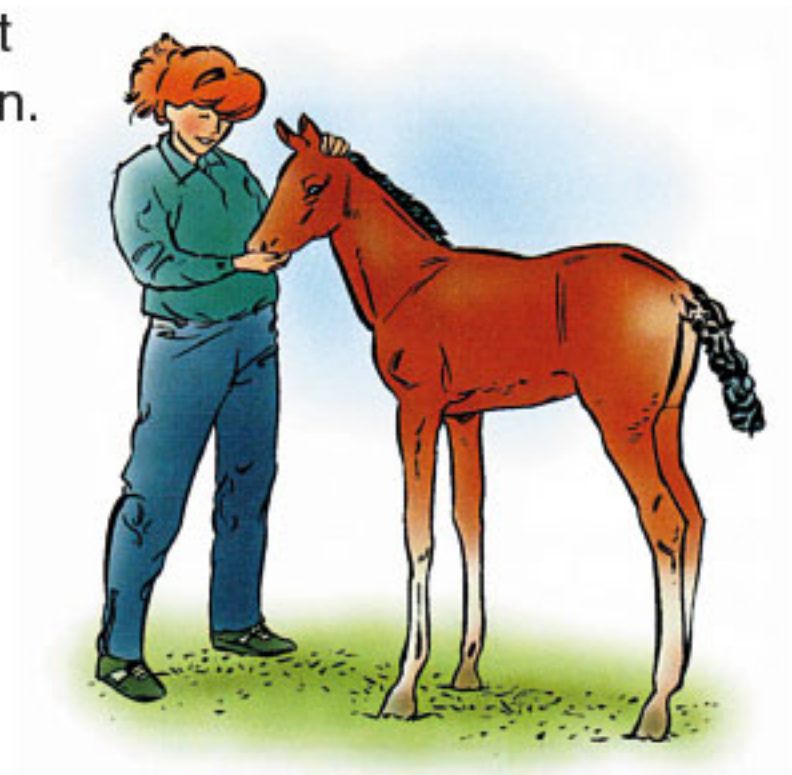
Hästens förtroende för människan byggs upp genom nära och positiv kontakt.

Om det är möjligt bör alla hästar köras in. Det betyder, att de ska läras att låta sig styras med hjälp av tömmar och vissa kommandon. Inkörningen kan ske vid två års ålder. Man bör vänta ytterligare ett år innan man börjar med inridning.