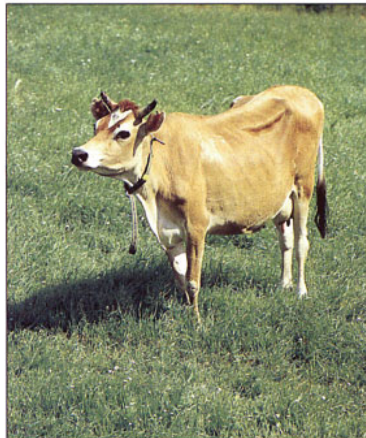
SJB (Svensk Jersey Boskap)

Förutom dessa raser finns ett litet antal djur av raserna SJB och SKB . SJB betyder Svensk Jersey Boskap och SKB betyder Svensk Kullig Boskap.