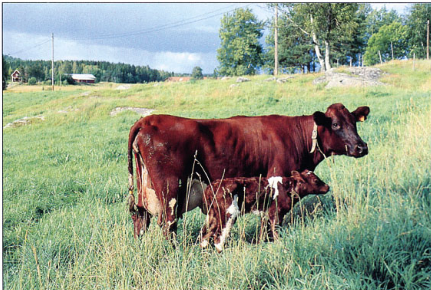
SRB (Svensk Rödbrokig Boskap)

Den vanligaste rasen av mjölkkor i vårt land heter SRB .