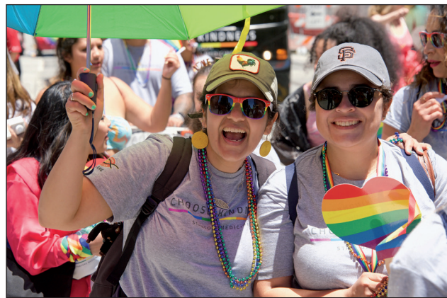
De firar att alla i Sverige har rätt att bli kära i vem de vill.