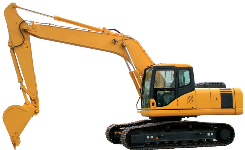
Sverige exporterar grävmaskiner.