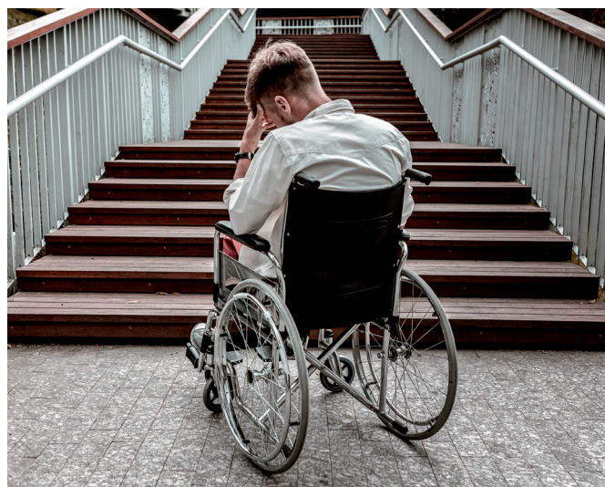
Han kommer inte upp för trappan med rullstolen.

Alla människor, oavsett ålder omfattas av lagens skydd mot diskriminering.