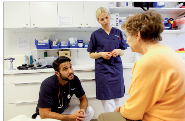
Skatt vi betalar går bland annat till sjukvården.