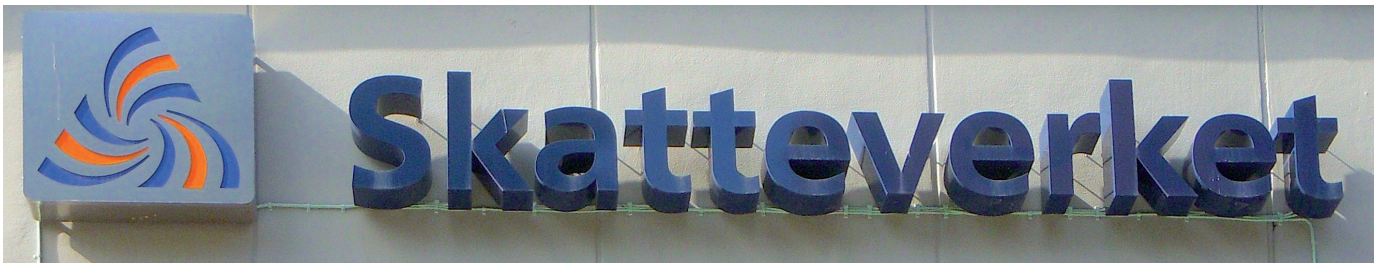
Skatteverket sköter skattepengarna i Sverige.