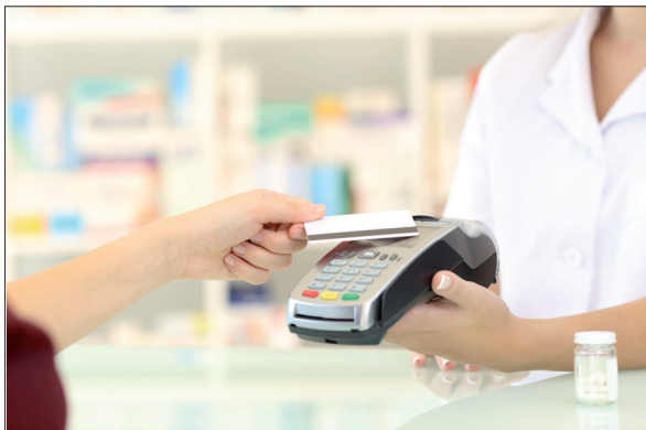
För vår lön kan vi handla de varor vi behöver.

De blir lön till de som jobbar i affären och hyra för att ha affärslokalen. Plus lite andra kostnader som affären har för att kunna sälja sina varor.