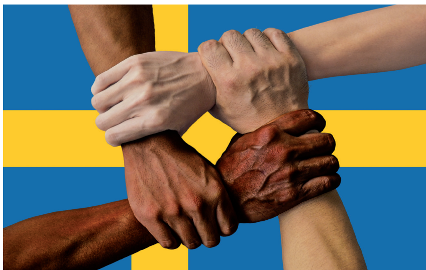
Det finns flera folkgrupper i Sverige.

De andra folkgrupperna kallas minoriteter, eftersom de inte är lika många.