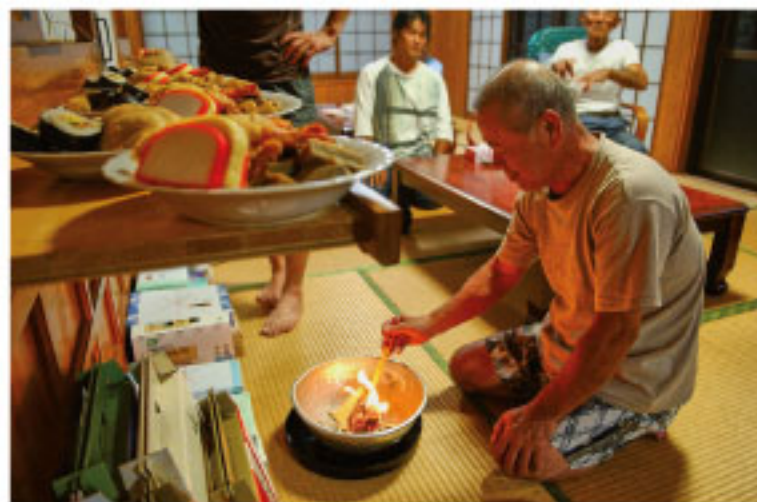
Buddhist ber och offerar till Buddha i sitt hem.

Det är också vanligt att lägga dit gåvor. Det kan vara en skål med friskt vatten, rökelse eller blommor.