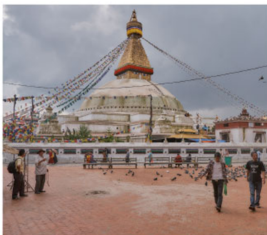
Stupa i Nepal.

En annan byggnad som finns vid vissa tempel är en stupa eller en pagoda. Den ska symbolisera Buddhas upplysta sinne.