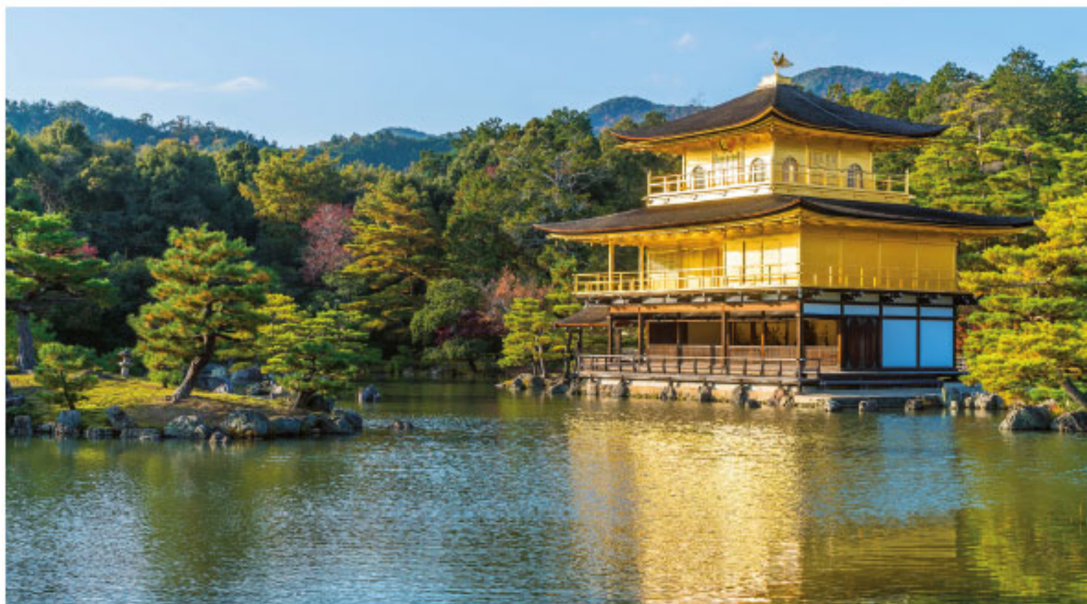
Buddhistiskt tempel i Japan.

Innan man går in i ett tempel tar man av sig skorna. Framför Buddhatatyn brukar det finnas ett bord där man kan lämna gåvor som blommor eller skålar med ris.