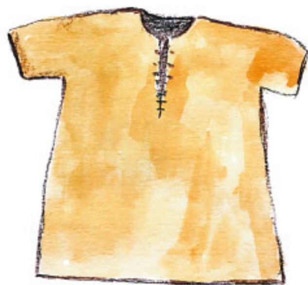
De små barnen gick klädda i kolt.

På fötterna hade man skor eller kängor. De var sydda av skinn och saknade klack.