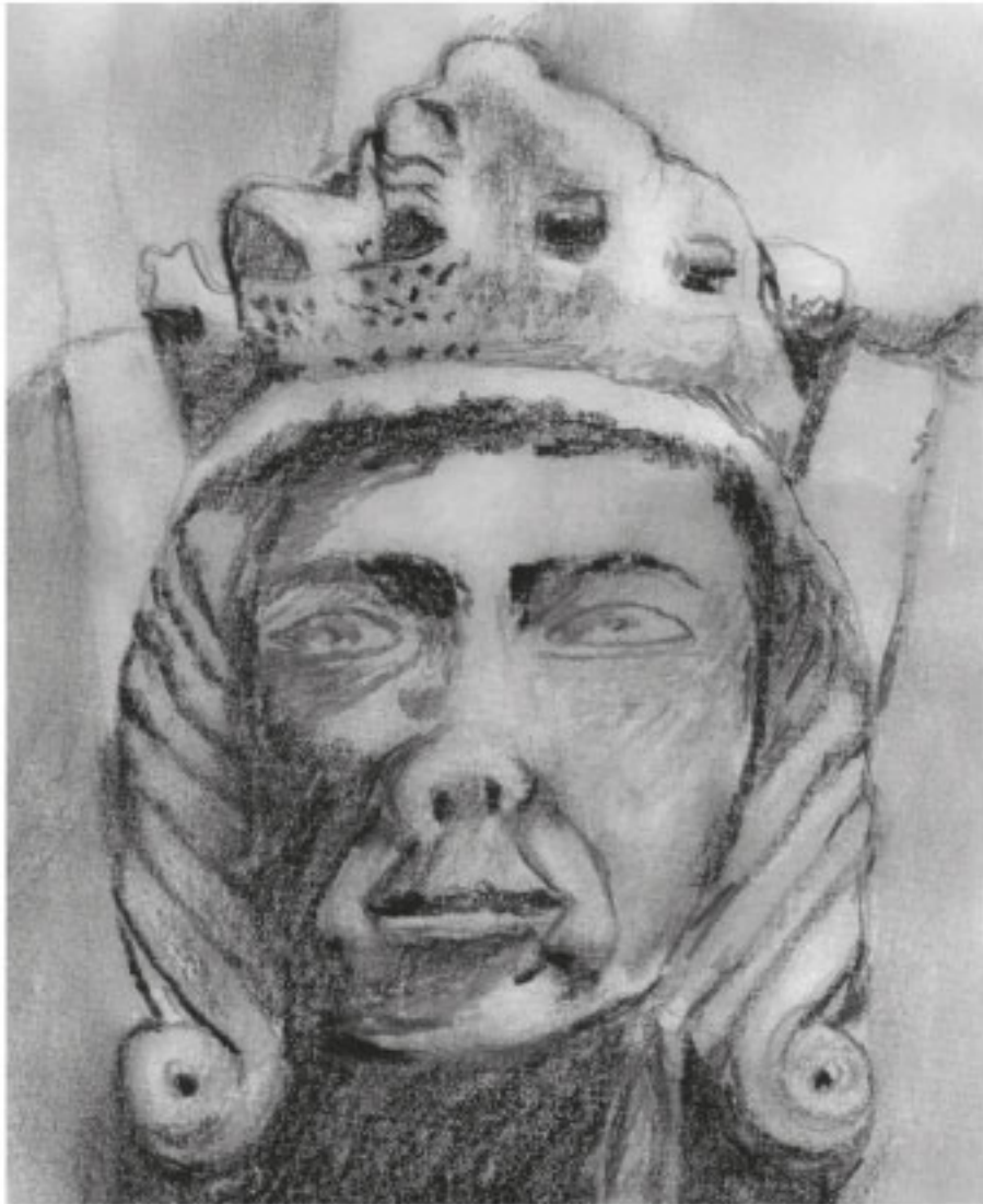
Valdemar Birgersson finns avbildad i Skara domkyrka.