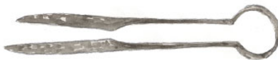
En sax tillverkad av järn.

På järnåldern hade rika människor smycken och spännen tillverkade av brons. De hade också smycken tillverkade av silver och guld.