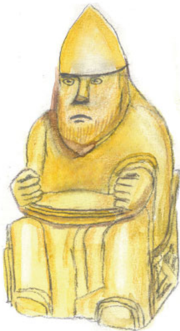
Frey med skeppet Skidbladner.

Freja ledde de kvinnliga varelserna, Valkyriorna. De hämtade hem de döda kämparna från slagfälten så de skulle få njuta av livet efter döden.