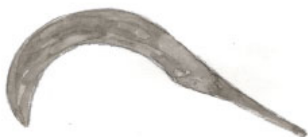
En skära tillverkad av järn.

Man kunde också smida saxar och synålar, som man använde till att klippa tyg och sy kläder.