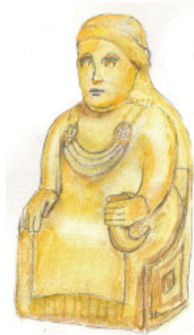
Freja var fruktsamhetens gudinna

Freja ägde också en falkdräkt, och förklädd till fågel kunde hon flyga runt jorden.