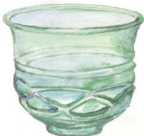
Det här är en glasbägare. Den har hittats på Öland.

De som var mycket rika hade bägare som var tillverkade av glas. Glasföremålen köptes från Europa.