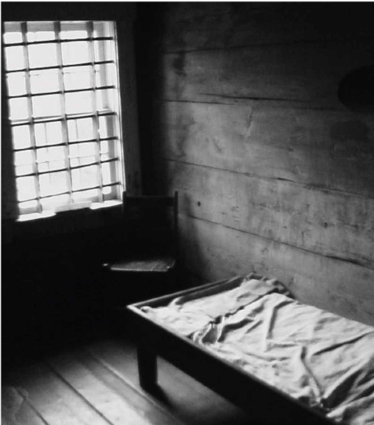
Fängelsecell från 1800-talet

De intagna fick arbeta hårt och bo trångt ihop.