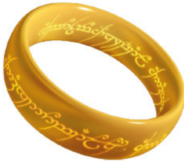
Härskarringen i Sagan om ringen

Du har kanske sett filmerna eller läst böckerna. J.R.R. Tolkien fick sina idéer från bland annat nordisk mytologi.