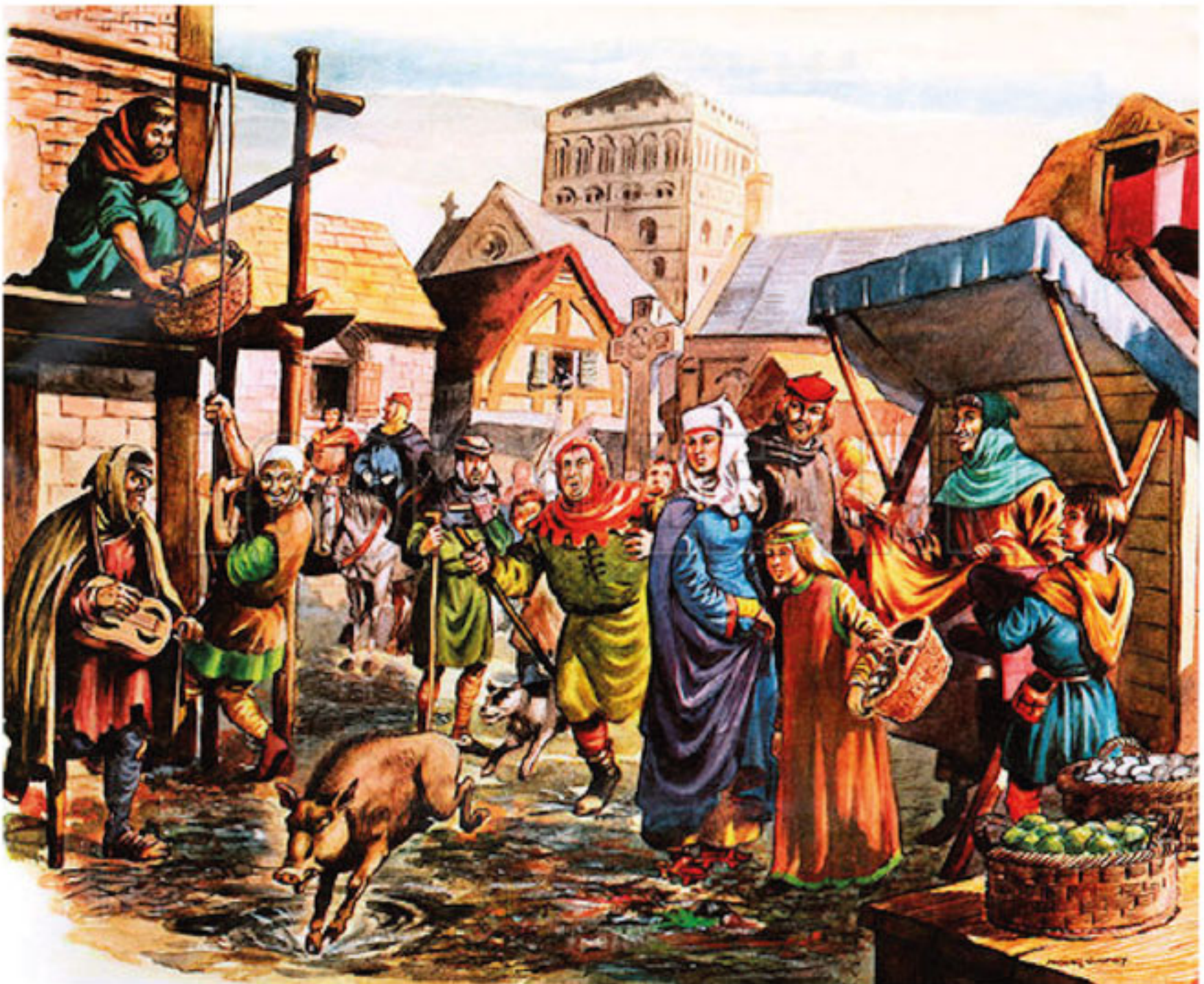
Gata på medeltiden

I en gammal text som handlar om Stockholm, står det att en utländsk diplomat en gång svimmade av stanken!