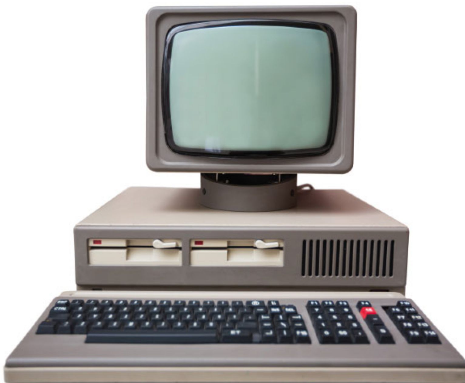
En tidig PC

Man kunde spela spel, skriva och räkna på dem. Även spelkonsoler blev populära. Där kunde man tävla med varandra. Nintendo och Playstation är kända tv-spelstillverkare.