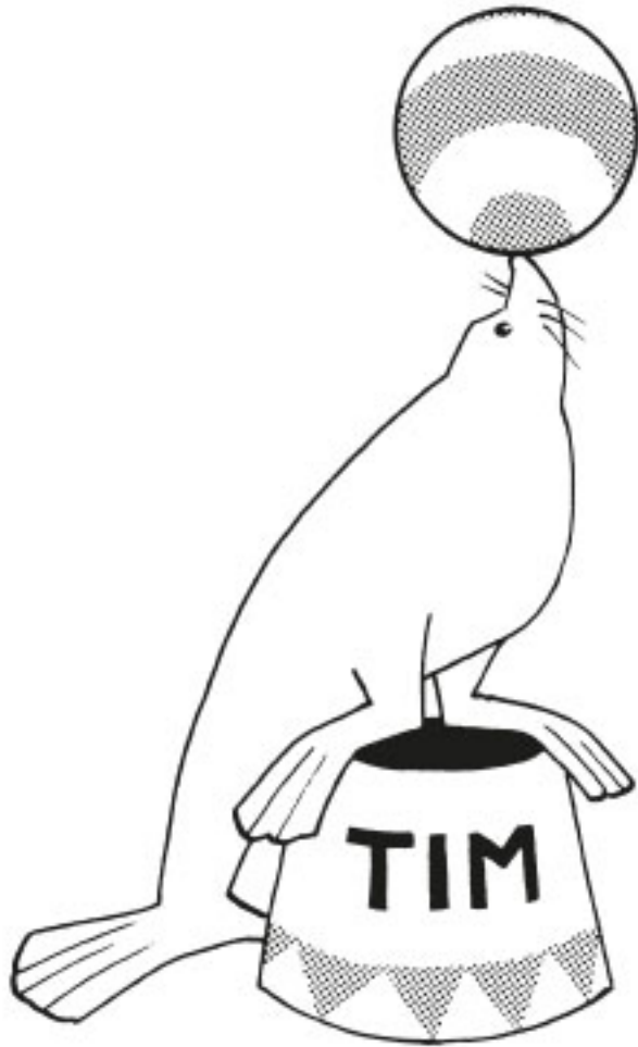
Du ger Tim