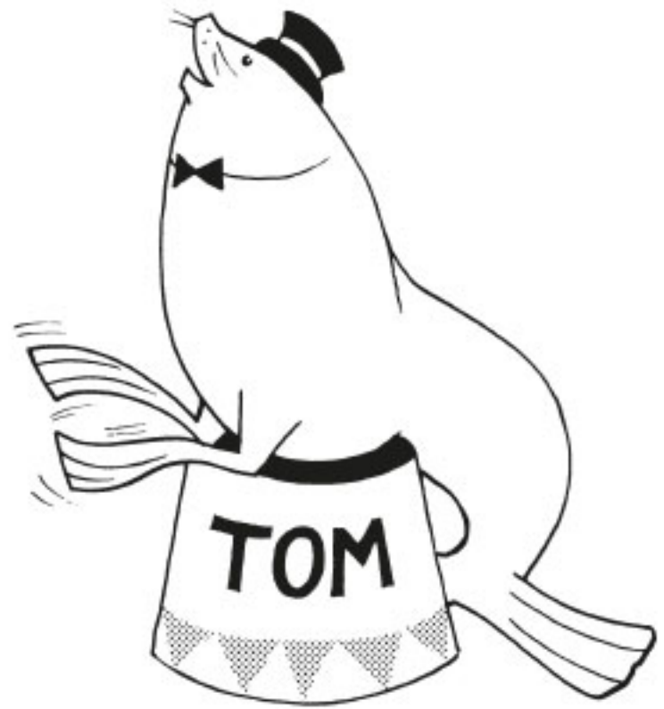
Då kan du ge Tom