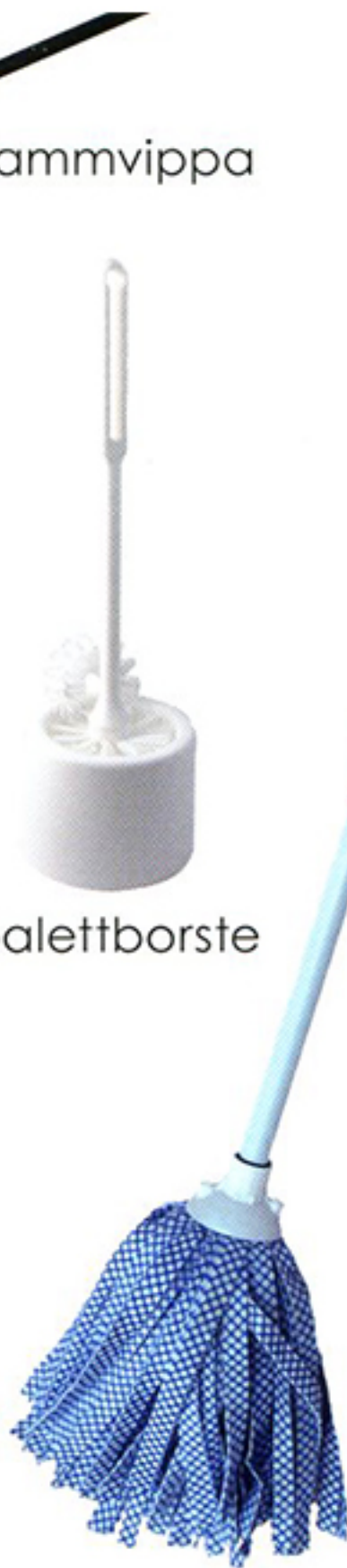
mopp eller skurborste med skaft